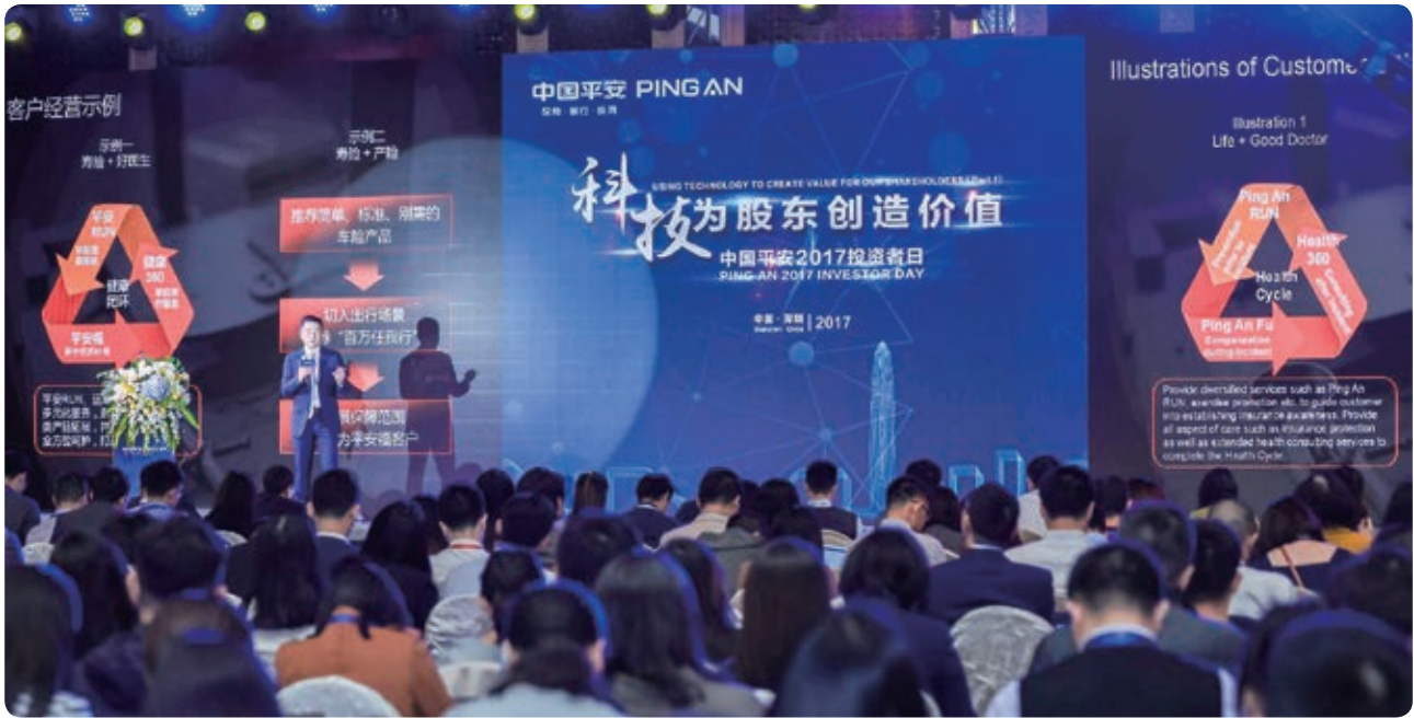
中国平安2017投资者日